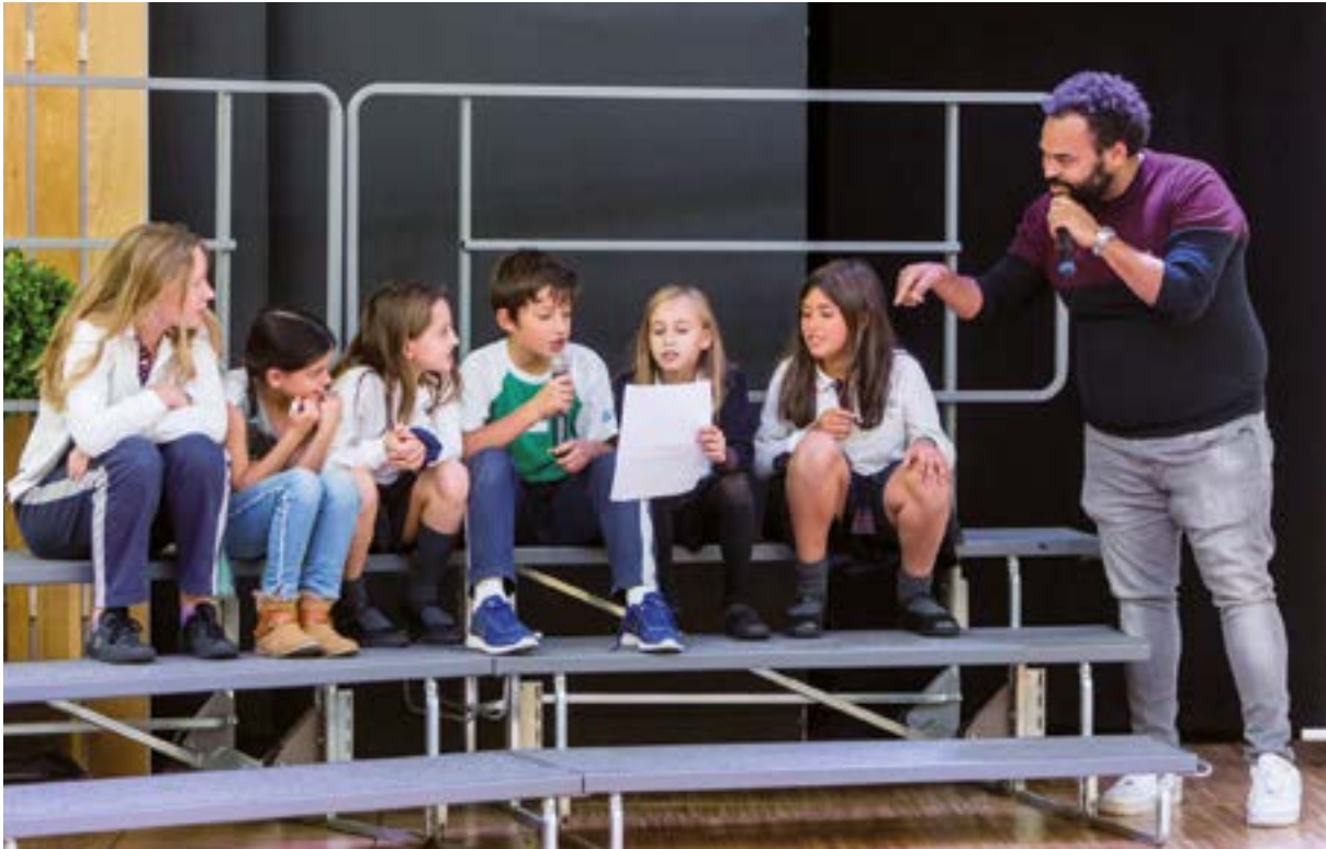
El productor Carlos Jean va col·laborar amb un centenar d'alumnes al Musicathon per produir una cançó contra l'abús infantil.

d'orientació laboral adreçada als seus alumnes de batxillerat.