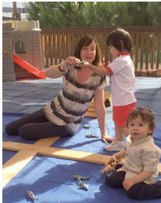
El Bilingual Baby Club és una activitat dissenyada perquè els pares gaudeixin amb els seus fills d'una activitat estimulants i divertida.

Prop de 2.000 famílies confien cada any en el model bicultural i bilingüe del Col·legi Britànic per a l'educació dels seus fills.