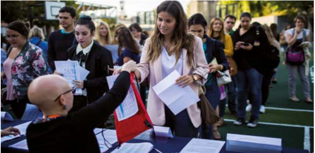
Més de 900 docents van començar el nou curs aprenent i compartint experiències a les nostres conferències Teaching for Success, celebrades a cinc ciutats.