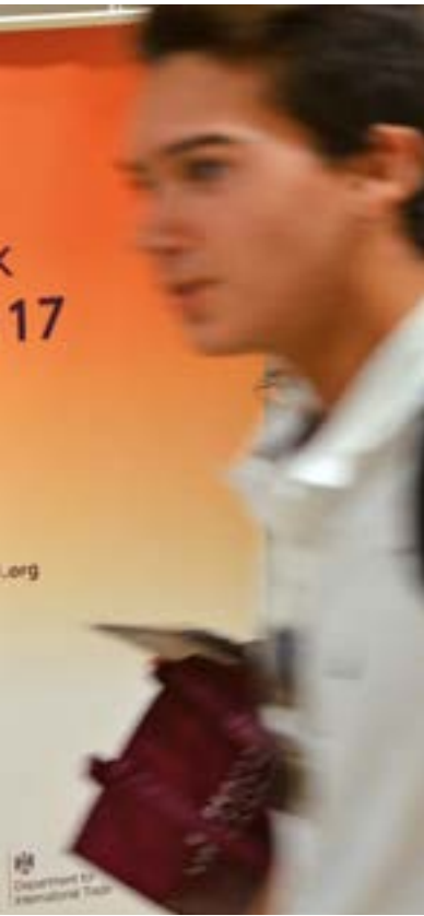
El British Council presentó la oferta de educación del Reino Unido en sus Ferias Study UK de Madrid y Barcelona.