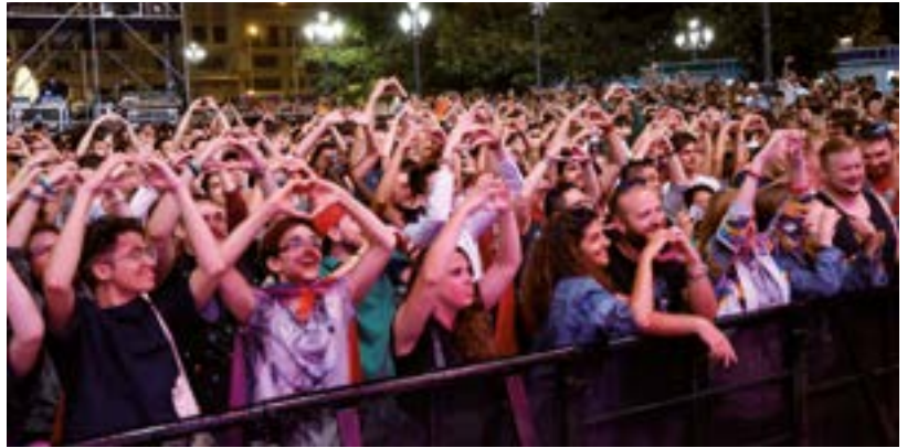
Más de 20 000 personas se reunieron en Madrid para celebrar el amor y la diversidad en nuestros conciertos con motivo del World Pride 2017.

En esta labor es fundamental el papel de nuestros estudiantes, de sus familias y de personas como tú. Por eso, te invitamos a compartir cualquier consulta, sugerencia o preocupación sobre la protección de los menores en protecciondelainfancia@britishcouncil.es .