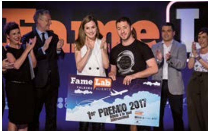
Su Majestad la Reina Doña Letizia asistió a la final de FameLab España 2017, en la que se proclamó ganador Pedro Daniel Pajares.