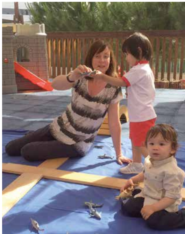
Bilingual Baby Club gurasoek euren seme-alabekin jarduera estimulagarri eta dibertigarri batekin gozatzeko diseinatutako jarduera da.

Urtero, 2000 familia inguruk euren seme-alaben irakaskuntza British Council Schoolearen eredu elebidun eta kulturbidunaren esku uzten dute.