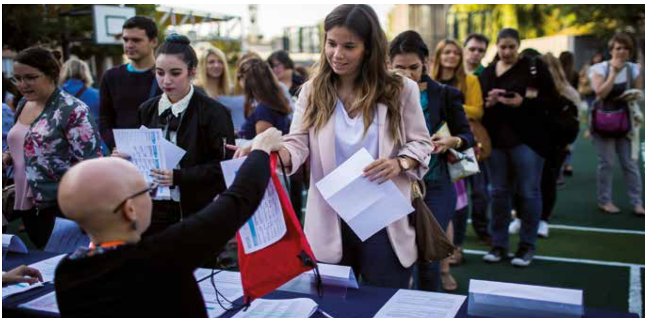
900 irakasle baino gehiagok ikasturte berria ikasiz eta esperientziak partekatuz hasi zuten bost hiritan ospatu ziren gure Teaching for Success batzarretan.