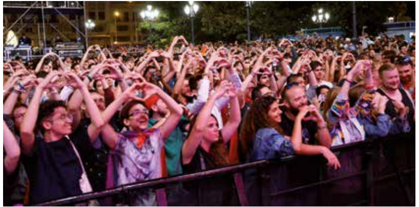
Más de 20 000 personas se reunieron en Madrid para celebrar el amor y la diversidad en nuestros conciertos con motivo del World Pride 2017.

Lan horretan, ezinbestekoa da gure ikasleen, euren familiaren eta zu bezalako pertsonen lana. Horregatik, izan dezakezun edozein galdera, iradokizun edo kezka partekatuzera gonbidatzen zaitugu protecciondelainfancia@britishcouncil.es helbidera idatziz.