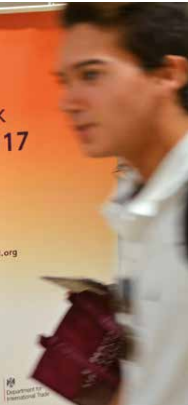
British Councilen Erresuma Batuko hezkuntza-eskaera aurkeztu zuen bartzelonako eta Madrilgo Study UK azoketan.