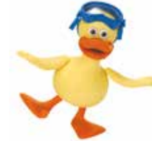
EARLY YEARS 4