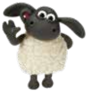
EARLY YEARS 2

Respectant les etapes clau del desenvolupament del nen/a aconseguim que assenti unes bases sòlides en anglès.