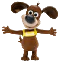
EARLY YEARS 3