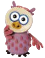
EARLY YEARS 5